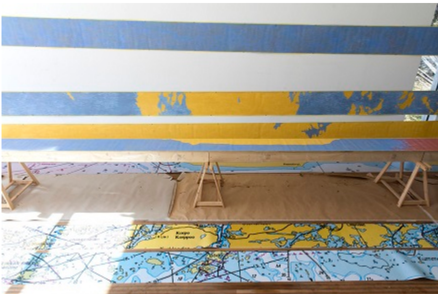
Polkupyöräbaanalle sijoittuva taidemaalari Silja Rantasen 180-metrinen Helsinki-aiheinen maalaus.