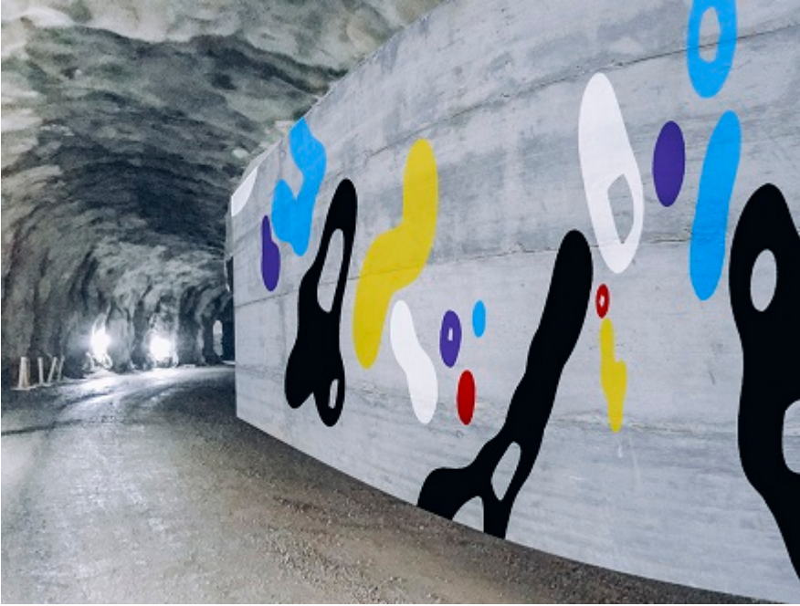
Graffititaiteilija Egsin maalaukset parkkiloolassa.